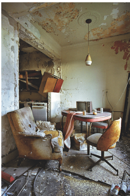
Déroit en ruines. 2007

Les citations de l'auteur sont extraites du texte édité aux éditions "J'ai lu" et traduit par du russe par Galia Ackerman et Pierre Lorrain